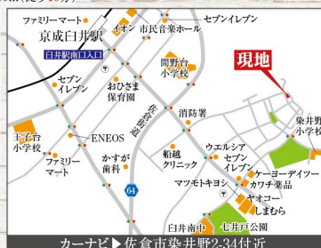
カーナビ▶佐倉市染井野2-34付近

※本物件は染井野S1地区建築協定及び緑地協定対象区域です。 ※本物件は染井野地区計画において、低層住宅地区(Ⅱ)に該当しています。閑静で質の高い良好な居住環境の形成・保全を図る為に、建築物等の用途の制限(敷地面積・整面・位置の制限等)があり、地区計画の趣旨に基づいたまちづくりが確定されています。 ※34-2・34-3号地は「みかわけ」街区 建設指針及び緑化指針の適応街区となります。 ※建物及び外構植栽等のプラン作成にあたり、売主が指定するコンサルタントによる。事前チェック及び承諾が必要になります。なおコンサルタント費用は売主の負担です。